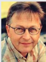
Bengt Grandelius leg psykolog och författare